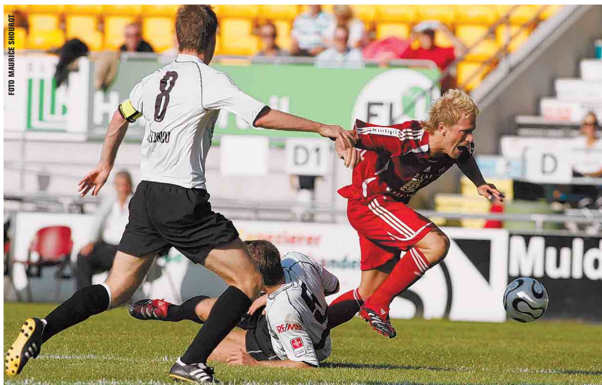
In der Hinrunde musste sich der FCV im Rheinpark-Stadion gegen Locarno mit einem mageren 2:2 begnügen.